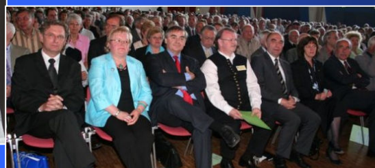
Fast 6000 Banater Schwaben waren zum Heimattag in Ulm angereist.