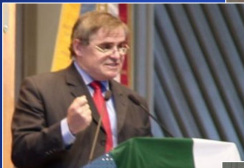
Ministerpräsident Peter Müller hob vor allem die „Wertegemeinschaft für Freiheit und Frieden“ hervor.